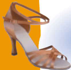
ART. 2051 ŠT.: 2-8 PETA: N. S, SF, VF MATERIAL: SATEN - BELI FLEŠ