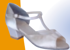
ART. 050 ŠT.: 13-8 PETA: N. S, SF, VF MATERIAL: SATEN - BELI FLEŠ, ZLATA, SREBRNA, BELO USNJE