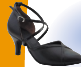
ART. 101 ŠT.: 2-8 PETA: N. S, SF, T MATERIAL: USNJE, USNJE / LAK