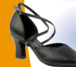
ART. 100 ŠT.: 2-8 PETA: N. S, SF, T MATERIAL: LAK, SATEN USNJE