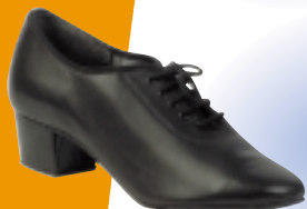
ART. 210 ŠT.: 5-8 PETA: U MATERIAL: USNJE, SEMIŠ