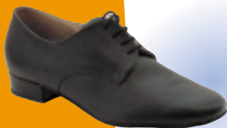
ART. 7100 ŠT.: 5-12 PETA: N MATERIAL: USNJE, LAK NUBUK / LAK