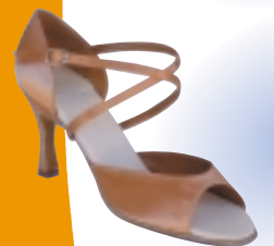
ART. 1003 ŠT.: 2-8 PETA: N. S, SF, VF MATERIAL: SATEN - BELI FLEŠ