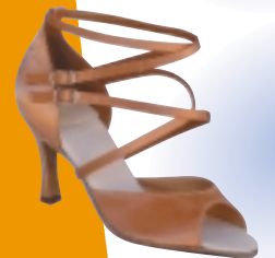
ART. 2002 ŠT.: 2-8 PETA: N. S, SF, VF MATERIAL: SATEN - BELI FLEŠ