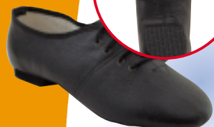
ART. 900 JAZZ ŠT.: 30-46 MATERIAL: ČRNO - BELO USNJE