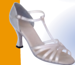
ART. 1050 ŠT.: 2-8 PETA: N. S, SF, VF MATERIAL: SATEN - BELI FLEŠ