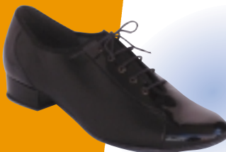
ART. 7200 ŠT.: 5-12 PETA: N MATERIAL: NUBUK / LAK USNJE / LAK