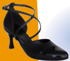
ART. 103 ŠT.: 2-8 PETA: N, S, SF, T MATERIAL: USNJE / LAK