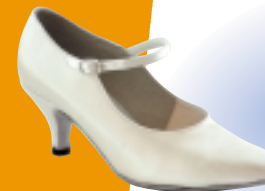
ART. 1115 ŠT.: 2-8 PETA: N. S, SF MATERIAL: SATEN - BELI