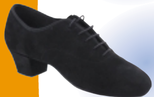
ART. 5200 - PRO ŠT.: 5-12 PETA: VO MATERIAL: USNJE, SEMIŠ, NUBUK