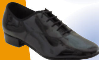
ART. 7000 ŠT.: 1-12 PETA: N MATERIAL: USNJE, LAK NUBUK / LAK