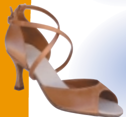
ART. 2000 ŠT.: 2-8 PETA: N. S, SF, VF MATERIAL: SATEN - BELI FLEŠ