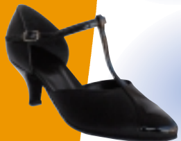
ART. 105 ŠT.: 2-8 PETA: N, S, SF, T MATERIAL: USNJE, LAK USNJE / LAK