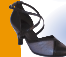
ART. 102 ŠT.: 2-8 PETA: N. S, SF, T MATERIAL: USNJE - LAK / BLEŠČICE