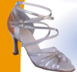
ART. 2252/M ŠT.: 2-8 PETA: N. S, SF, VF MATERIAL: SREBRNA / FLEŠ ZLATA / FLEŠ