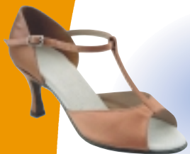
ART. 1000 ŠT.: 2-8 PETA: N. S, SF, VF MATERIAL: SATEN - BELI FLEŠ