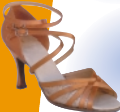
ART. 1052/B ŠT.: 2-8 PETA: N. S, SF, VF MATERIAL: SATEN - BELI FLEŠ