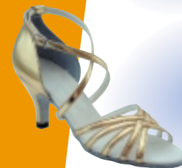
ART. 2050 ŠT.: 2-8 PETA: N. S, SF, VF MATERIAL: SATEN - BELI, FLEŠ ZLATA, SREBRNA