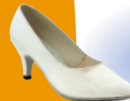
ART. 1100 ŠT.: 2-8 PETA: N. S, SF MATERIAL: SATEN - BELI