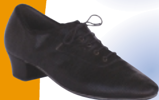
ART. 5000 ŠT.: 1-12 PETA: V MATERIAL: USNJE, SEMIŠ, NUBUK