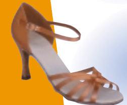
ART. 1051 ŠT.: 2-8 PETA: N. S, SF, VF MATERIAL: SATEN - BELI FLEŠ